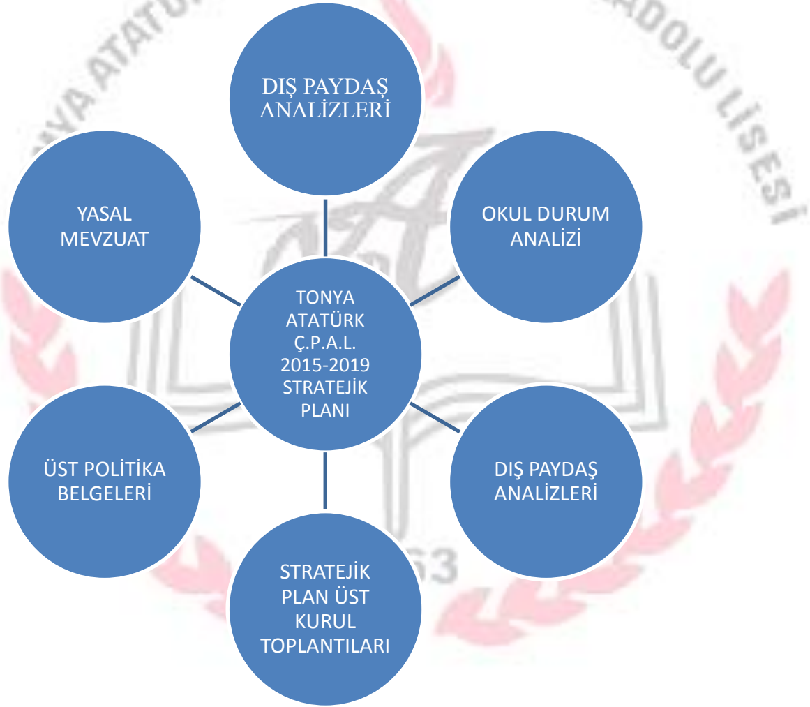
Şekil 2:Stratejik Plan Hazırlık çalışmaları

Tonya Atatürk Çok Programlı Anadolu Lisesi olarak eğitim öğretim sistemimizdeki değişimlere ayak uydurabilmenin ve başarılı ve mutlu bireylerin yetiştirebilmenin, stratejik planımızın başarıya ulaşabilmesine bağlı olduğu düşüncesiyle okulumuzda Stratejik Plan çalışmaları başlamış ve öncelikle “Stratejik Plan Üst Kurulu” oluşturulmuştur. Daha sonra, plan hazırlıklarının tamamlanması, üst kurula belirli dönemlerde rapor sunmak ve üst kurulun önerileri doğrultusunda gerekli çalışmaları yürütmek üzere “Okul Stratejik Plan Ekibi” oluşturulmuştur.